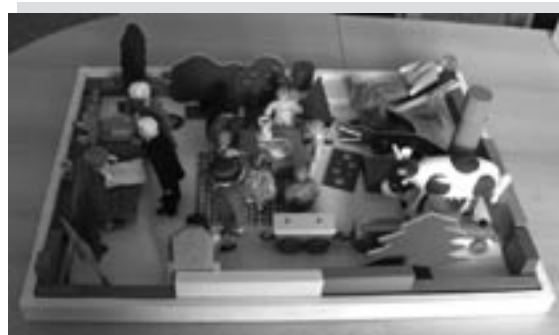
Stavba sedmileté dívky ( syndrom CAN)

Metoda Scénotestu se dá dobře využít se všemi dětskými a dospívajícími klienty. Pozorování dítěte při jeho hře umožňuje zachytit stádium vývoje dětského klienta, ale také dovoluje nahlédnout do jeho vnímání světa, poznat dětská přání pochopit způsoby, kterými se vyrovnává se svými problémy. Svůj potenciál má také využití Scénotestu v terapii rodin, ale setkat se s ním mohou stejně tak i samotní dospělí klienti. Hra může být také na jejich cestě hledání významným prostředkem nacházení odpovědí. S dospělými klienty pracuje metodou Scénotestu Mgr. Eva Bicanová.